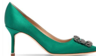
Manolo Blahnik Hangisi Dècolletè Green Crystal Fibia