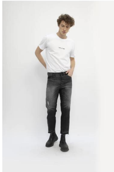
apollo carrot jean unisex - upcycled garment