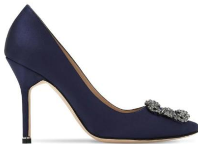
Manolo Blahnik Hangisi Dècolletè Dark Blue Crystal Fibia