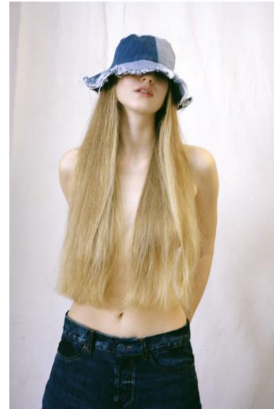
benni bucket hat - upcycled garment