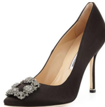
Manolo Blahnik Hangisi Dècolletè Black Crystal Fibia