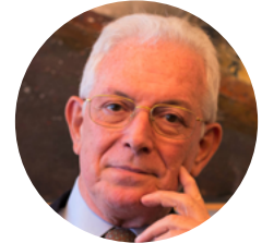
Federico Butera , professore emerito di scienze dell'organizzazione – UNIVERSITÀ DI MILANO BICOCCA e UNIVERSITÀ DI ROMA SAPIENZA