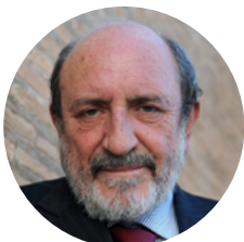
Umberto Galimberti , filosofo, saggista e psicoanalista, nonché giornalista