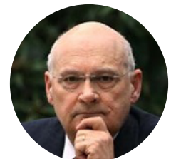
Stefano Zamagni , professore ordinario di economia politica – UNIVERSITÀ DI BOLOGNA e fondatore – SCUOLA ECONOMIA CIVILE