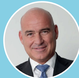
Ferruccio Resta Rettore POLITECNICO DI MILANO