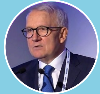
Giovanni Costa Professore emerito di organizzazione aziendale e strategia d'impresa UNIVERSITÀ DI PADOVA